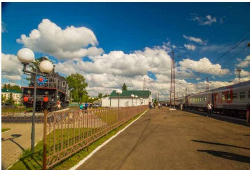
La stazione Ilanskaya, uno dei tanti scenari siberiani che incontreremo lungo il nostro viaggio verso Novosibirsk

Dopo una notte e un giorno di viaggio eccoci in Siberia, in serata arriveremo a Novosibirsk. Trasferimento in hotel e pernottamento.